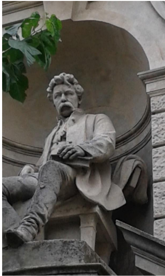
At the famous Csonka Tower in Nagyszalonta