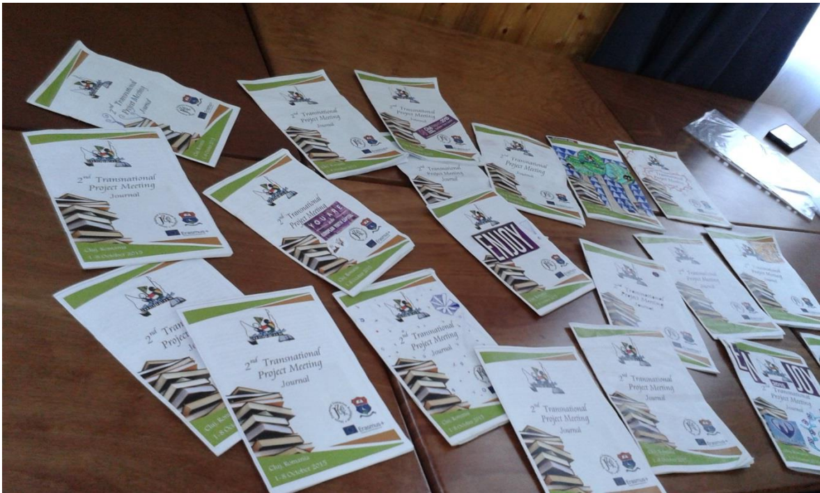
Journals of the 2nd Transnational Project Meeting