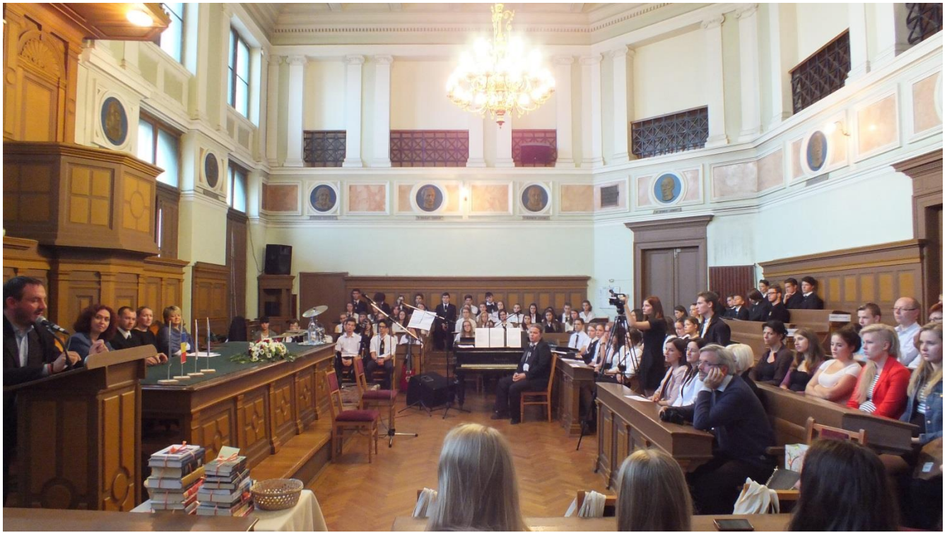
Fantastic opening ceremony