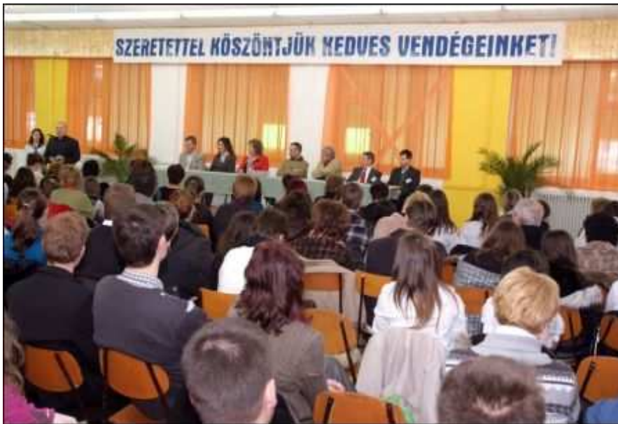
Megnyitó ünnepség a Lotz János szövegértési és helyesírási verseny országos döntőjén

Az előző évekhez hasonlóan a 2013–2014. tanévben is 3–4000 között mozgott a nevezők létszáma. Az iskolai fordulót 2013. december 10-én írták a diákok saját iskolájukban, közülük 945 fő jutott a megyei, illetve a fővárosi fordulóba, amelyet 30 helyszínen rendeztünk meg 2014. január 21-én. A megyei feladatokat az országos zsűri egységesen javította, és a legjobb 95 diákot hívtuk meg a március 21–22-én Bonyhádon szervezett országos döntőbe. A különböző fordulókön részt vevő diákokat emléklappal, illetve oklevéllel, valamint könyvekkel jutalmaztuk. A kétnapos rendezvényen a kísérő magyar szakos tanároknak a tanításban is alkalmazható gyakorlatokat bemutató elméleti-módszertani előadásokat szerveztünk. Ebben az évben Ohnmacht Magdolna A helyesírás túl címmel tartott előadást, amíg a diákok a versenyfeladatokat írták.