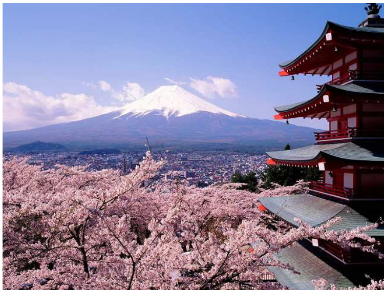
A Fuji és a cseresznyefák